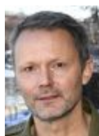
Felix Herngren.