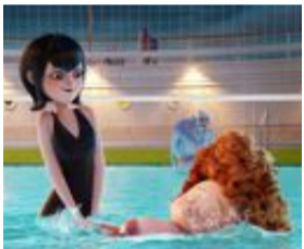
Monstersemester i "Hotell Transylvanien 3"