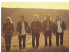
The Bland är ett av tre band som spelar på gårdsfesten.

Det är krogen Hava som tillsammans Crêperie Lemony och Studieförbundet Bilda står bakom arrangemanget. Under många år hölls en årlig gårdsfest i Katalins regi på innergården i hörnet S:t Olofsgatan–Svartbäcksgatan. Nu har Hava tagit över stafettpippen och även involverat sina grannar. På scenen utlovas musik av de tre Americanainfluerade Uppsalagrupperna Grand Trunk Travellers, The Bland och Lighthouse Sweden. (UNT)