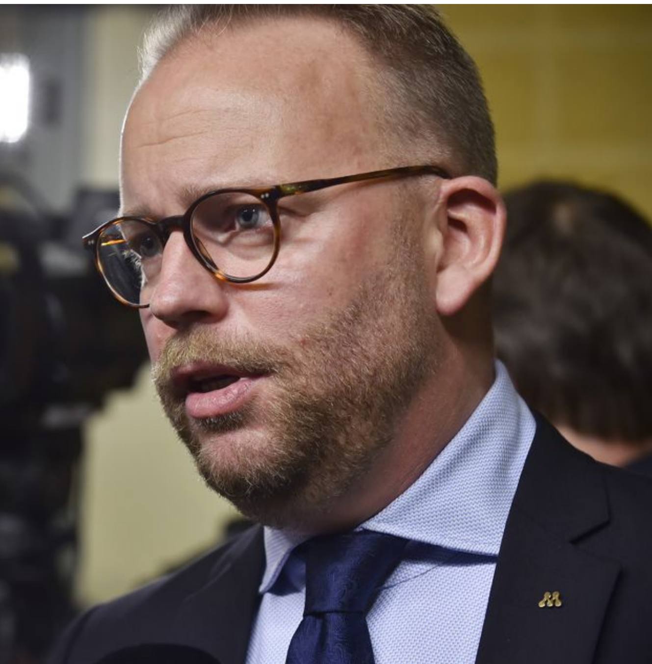
tet och känner oro för att konsten inte längre är lika fri som förut.